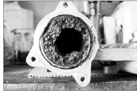
■ L'encrassement après 120.000 km.

Les additifs au carburant, utilisés à doses homéopathiques, sont plus ou moins efficaces. De plus, peu d'automobilistes