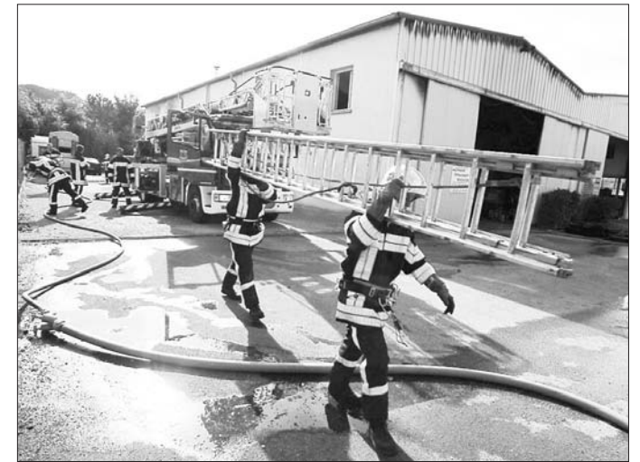
■ Les pompiers de Besançon ont rapidement « tué » l'incendie.

Avanne-Aveney. Samedi matin, un incendie a ravagé une partie des locaux de l'entreprise de maçonnerie La rénovation, située rue des artisans dans la commune d'Avanne-Aveney.