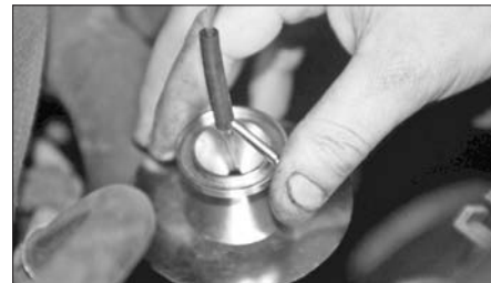
■ Un fluide est injecté dans l'admission d'air par un venturi.

pratiquent cet entretien préventif, qui ne guérit pas le circuit d'admission d'air. « L'encrassement des collecteurs d'admission et de la valve EGR conduit à une perte de puissance, à des fumées à l'échappement et à l'allumage du voyant de contrôle moteur », constate Pascal Miseré, de MP Développement à Boulot (Haute-Saône).