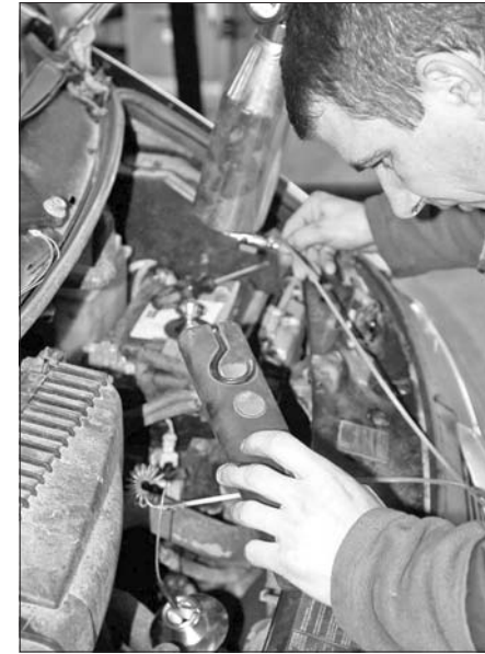
■ La calamine et les suies s'accumulent et affaiblissent la puissance. L'opération de nettoyage dure entre une et deux heures.

« Un fluide injecté par un venturi placé sur l'admission d'air est envoyé sur les parois pour les décharger des impuretés. Ce dispositif simple à installer permet d'éliminer en douceur la calamine et les suies accumulées dans le collecteur d'admission jusqu'aux soupapes qui sont inaccessi-